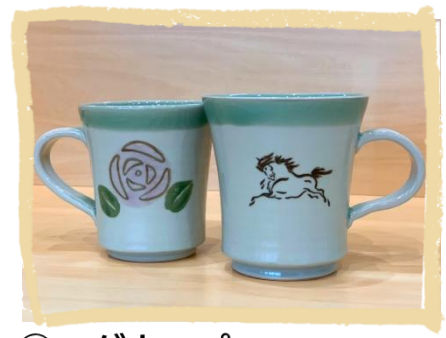
③マグカップ。 ※花柄はピンクとブルーの2色セットです。